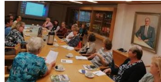
Tutustumassa Salon perusterveydenhuollon toimintaan 2019.