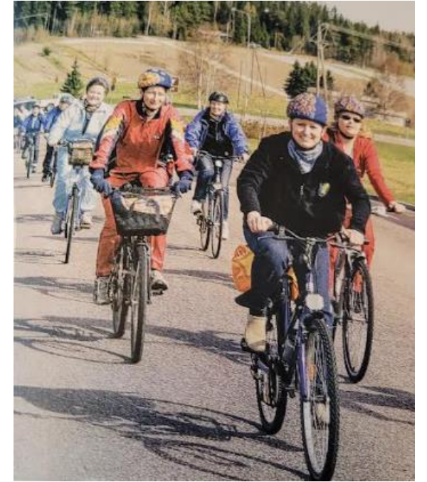
2005 kansainvälisenä sairaanhoitajapäivänä. Fillariviestillä mielenterveyden asialla.