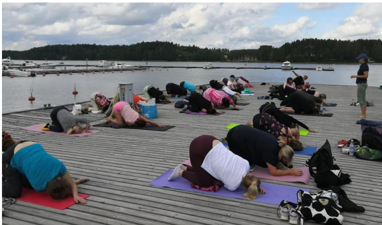
Laiturijooga ennen lounasta