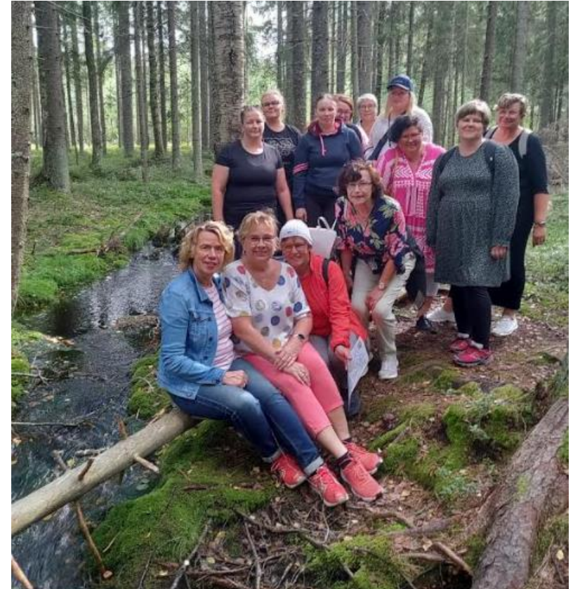
Lounaan jälkeen voi suunnata metsään, uimaan tai tutustua alueeseen muuten vain. Kuvassa metsäretken valinneet osallistujat.