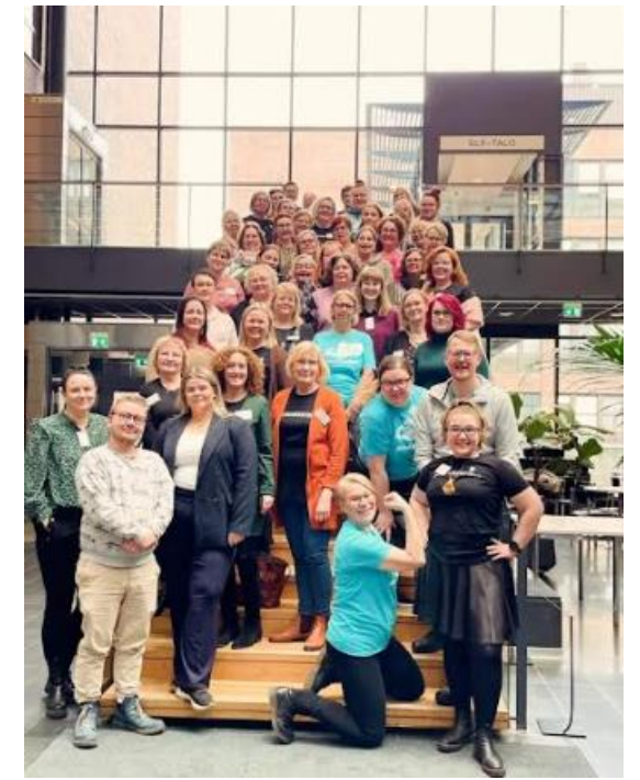
Suomen Sairaanhoidajat järjestävät yhteisiä kehittämispäiviä aktiivijäsenille valtakunnallisesti. Kuvassa alueyhdistysten yhteinen aktiivitoimijoiden päivä Helsingissä 2024.