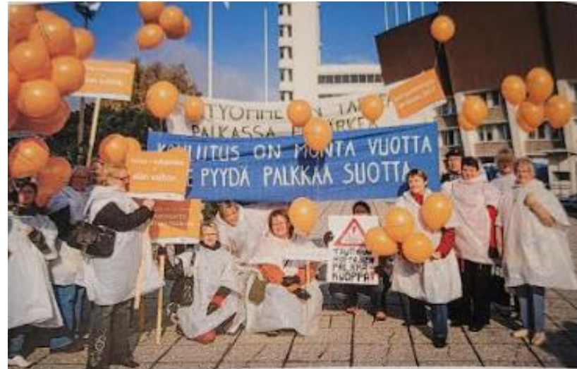
Bussilastillinen alueyhdistyksen jäseniä Sairaanhoitajaliiton järjestämällä mielenilmausmarssilla Helsingissä 2007.

Vaikutamme, verkostoidumme ja pidämme hauskaa. Yhdessä. Ammatillisen osaamisen kehittämistä ja vaikuttamistyötä unohtamatta.