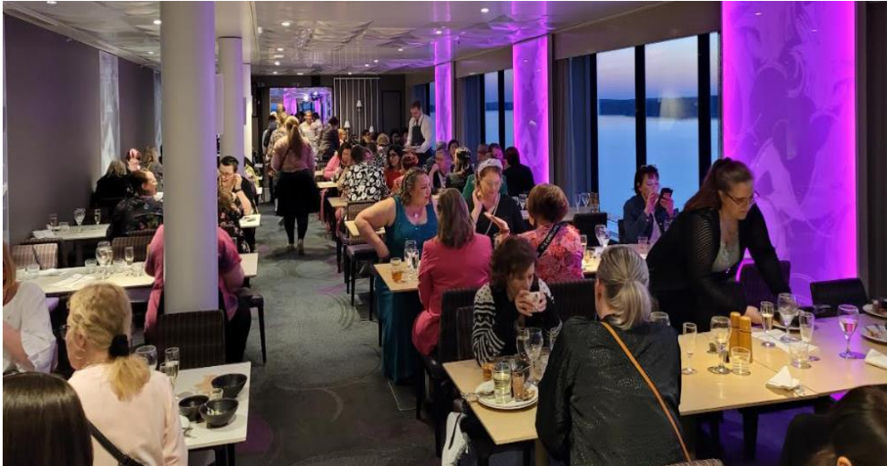
Yhteinen illallinen buffet ravintolassa

Alueyhdistyksemme järjesti valtakunnallisen Turku-Tukholma risteilytapahtuman kansainvälisen sairaanhoitajapäivän kunniaksi toukokuussa 2023.