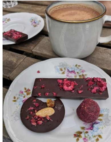
Mahtavan päivän päättää suklaamaistelut Petri's Chocolate kahvilassa

Jo perinteeksi muodostunut Mathildedalin retki järjestetään 2024 jo neljättä kertaa Suomen luonnon päivänä elokuussa. Tapahtumaan kuuluu laiturijooga, lounas, mukavaa yhdessä oloa sekä kahvihetki suklaakahvilassa. Retki kasvattaa suosiotaan ja joka vuosi osallistujia on enemmän.